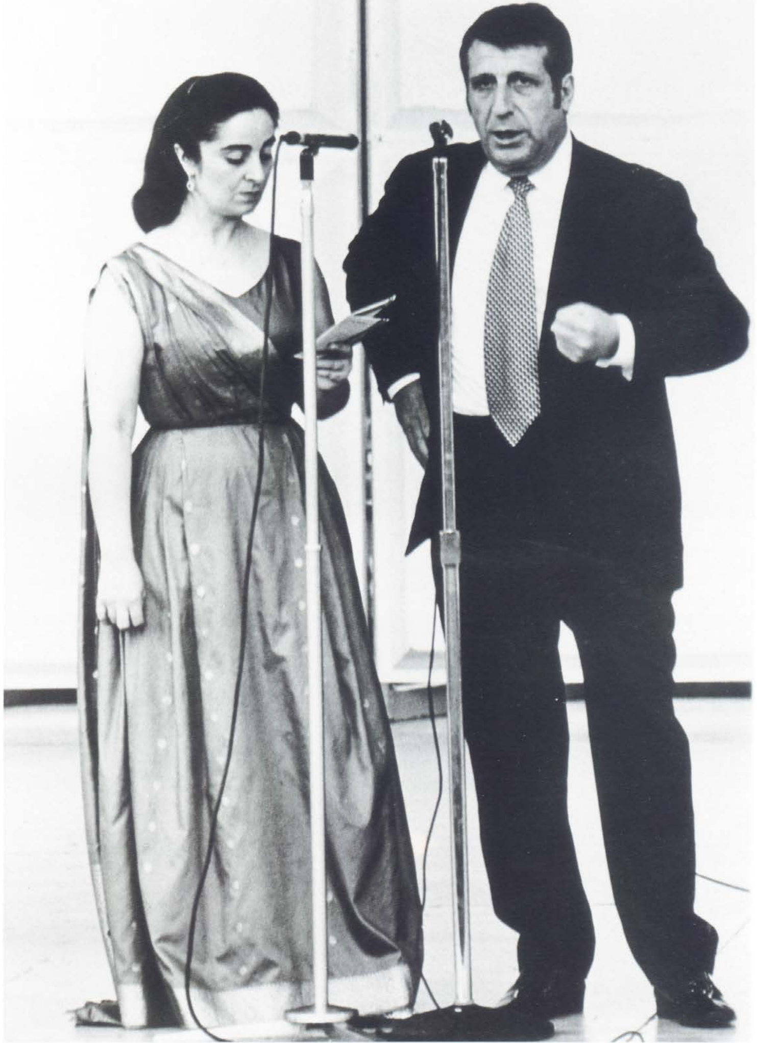
Arno Babajanian and Lucy Ishkanian at the 'Roand Top Music' Festival, Առնո Բաբաջանյանի հետ