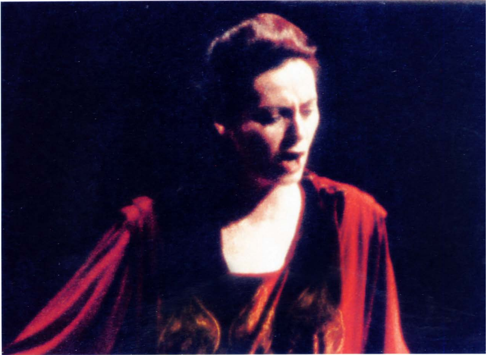
Hasmik as Odabella in Verdi's Attila , at Teatro alla Scalla, Milan (Detail) Օդաբեղաի դերում, Վերդիի «Աթիլա», Լա Սկալա, Միլան