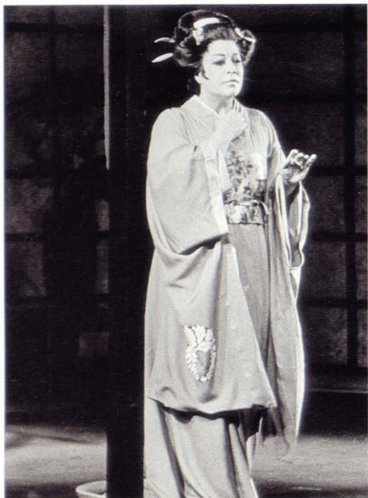
As Chio-chio San in Puccini's Madame Butterfly