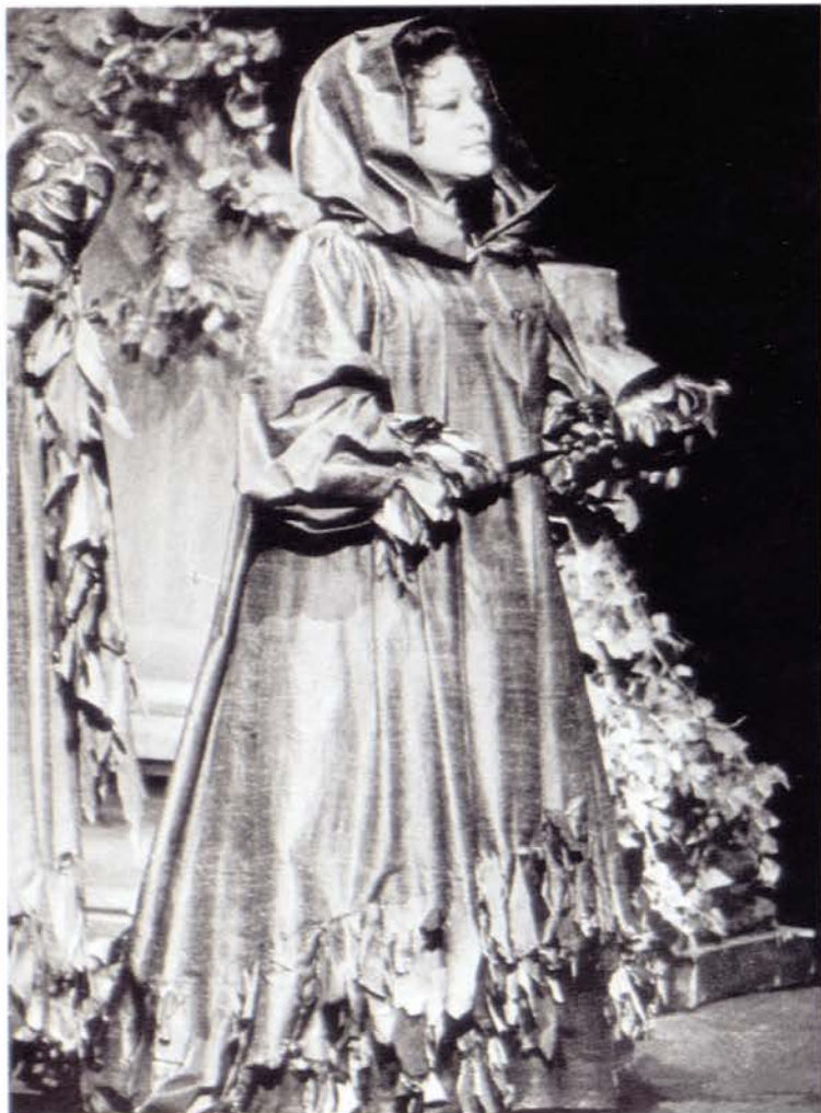
As Donna Anna in Mozart's Don Giovanni