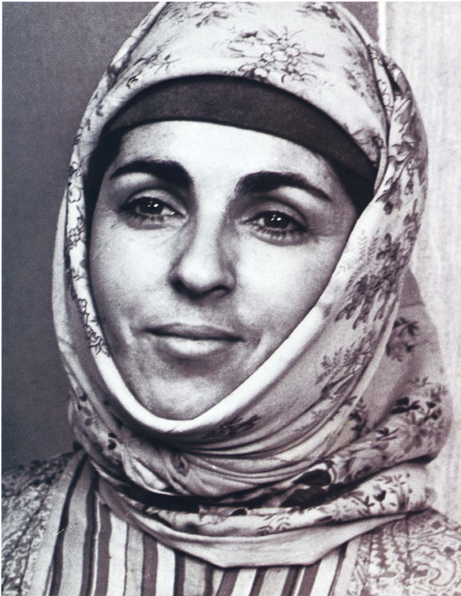
As Antaram in the movie Nahabet Անթարամ «Նահապետ» կինոնկարում