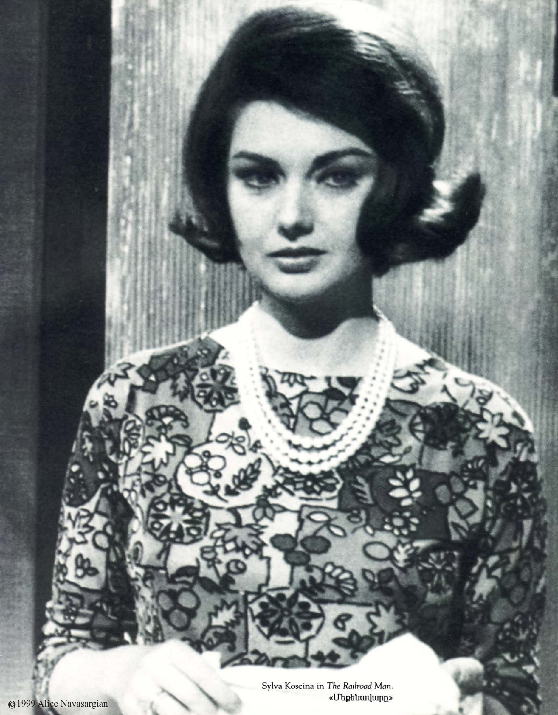
Sylva Koscina in The Railroad Man . «Մեքենավարը»