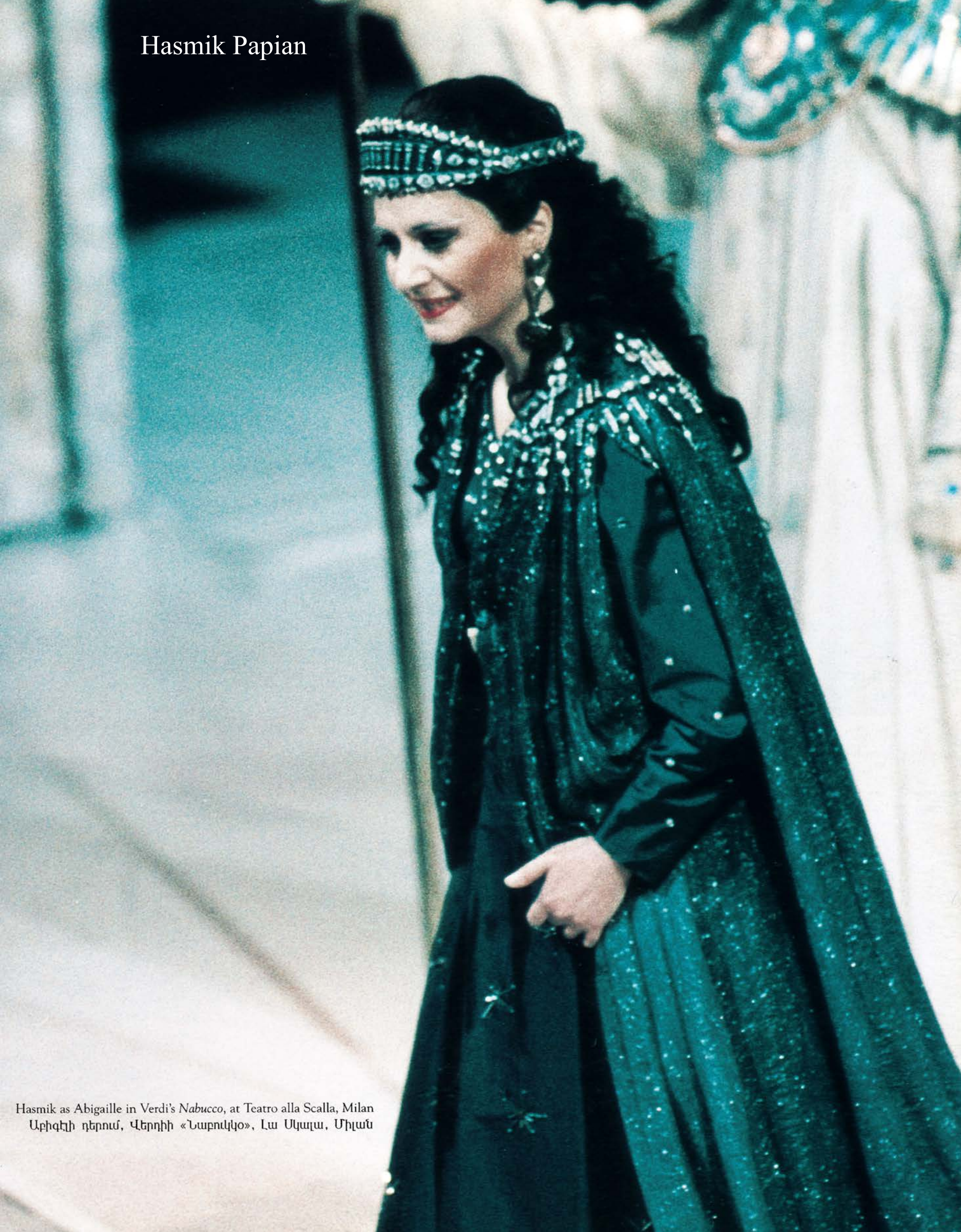
Hasmik as Abigaille in Verdi's Nabucco , at Teatro alla Scalla, Milan Արիզելի դերում, Վերդիի «Նաբուկկո», Լա Սկալա, Միլան