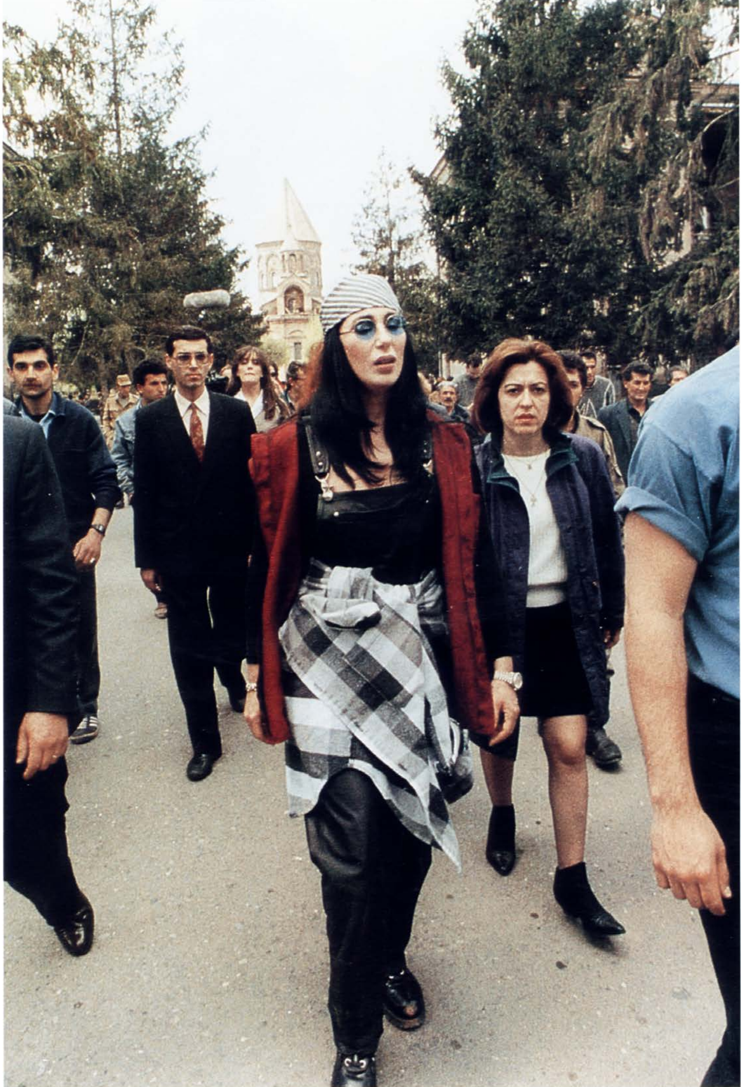
Cher in Etchmiadzin, Armenia (1993) Շերը Էջմիածնում