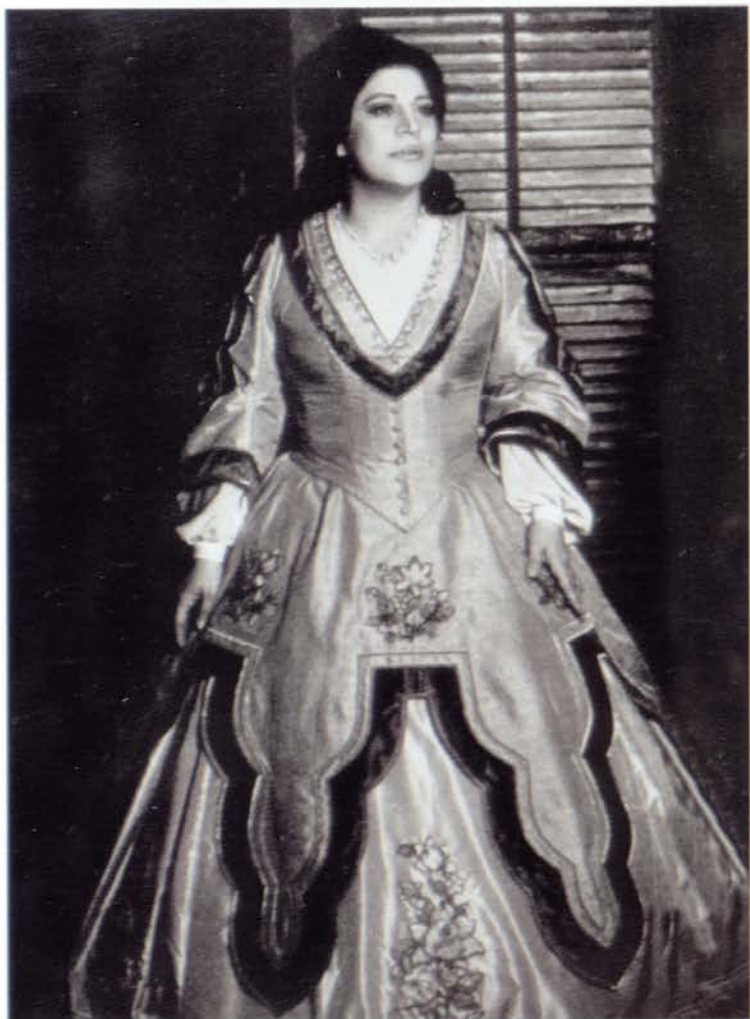
As Amelia in Verdi's A Masked Ball