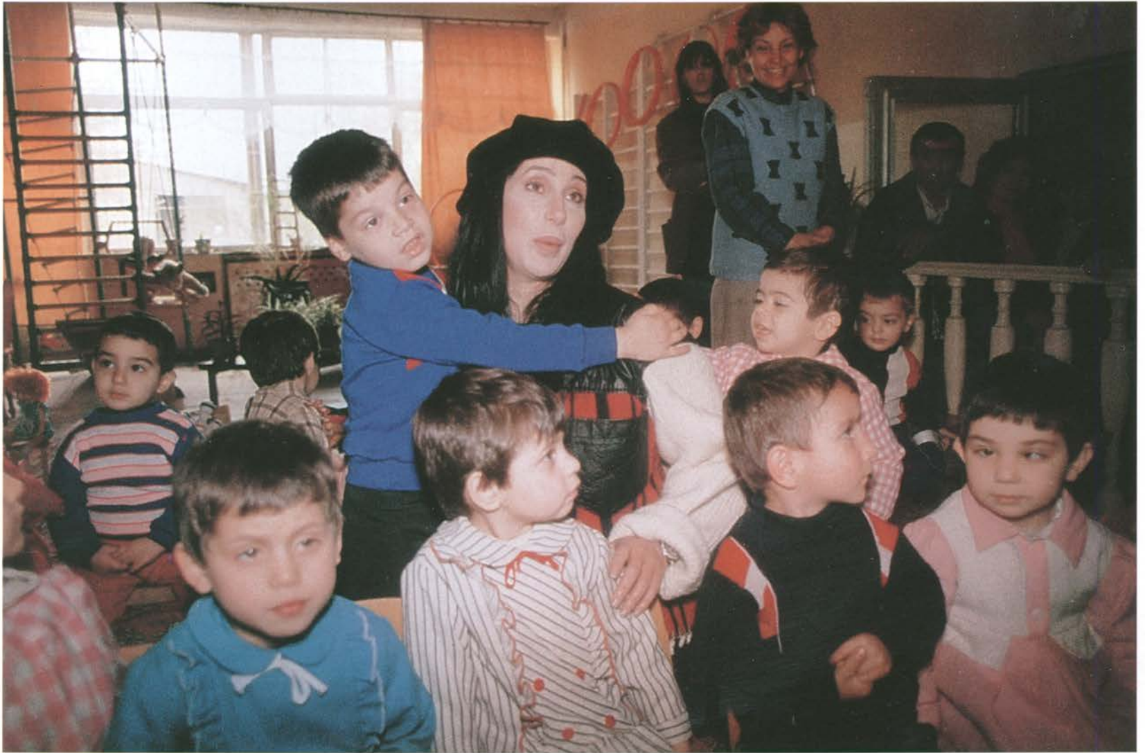
Cher at the orphanage, Yerevan, Armenia

“It’s amazing how you stop taking basic things for granted.. Armenia was the strangest trip I’ve ever taken, and the most difficult one. But it was also the most rewarding one, a trip I will remember as long as I live”. (1993)