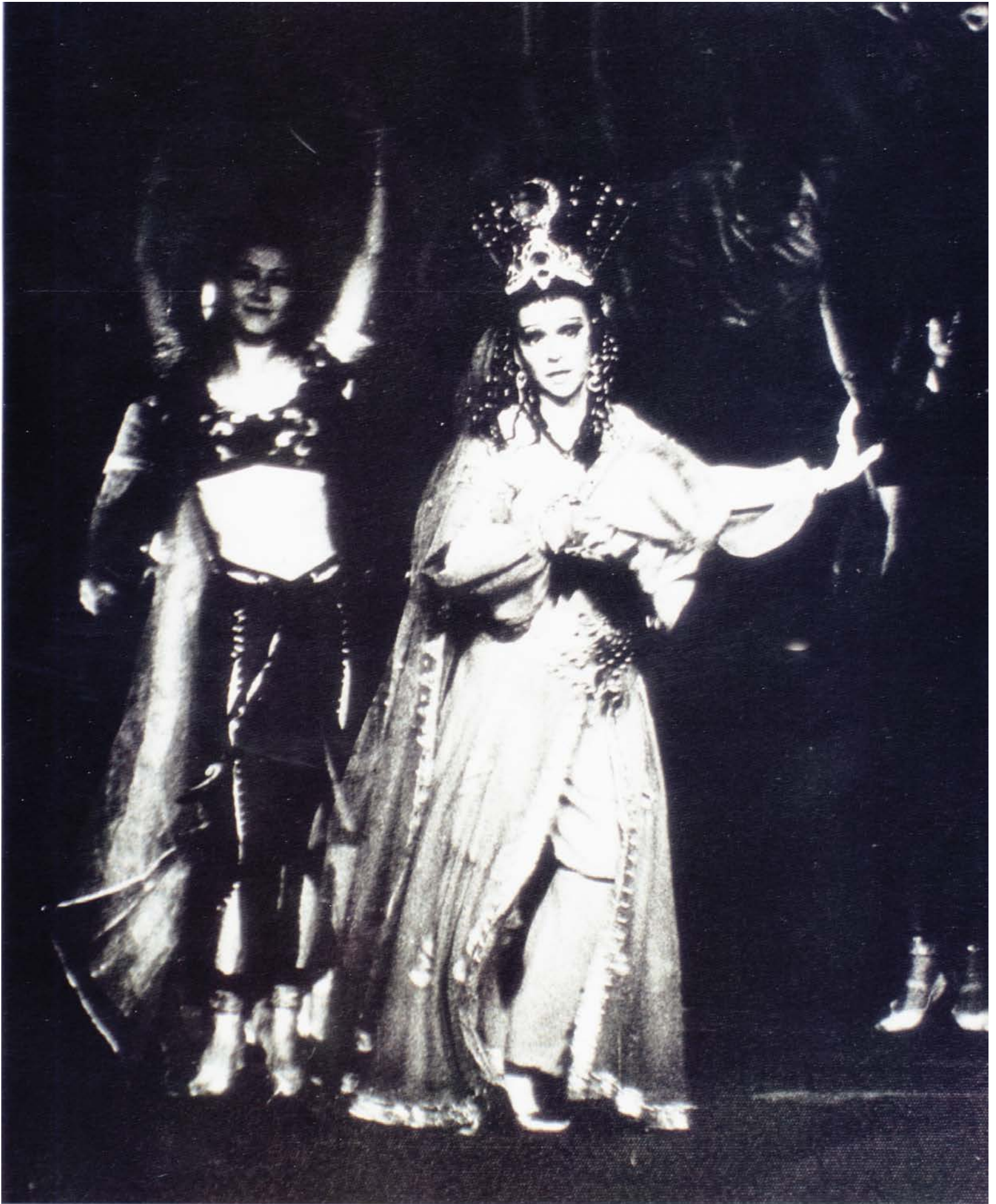
Elada as Queen of Shemaka in Rimsky Korsakov's The Golden Cockerel Շամախիի թագուհու դերում, Ռիմսկի-Կորսակովի «Ոսկե աքաղաղը»