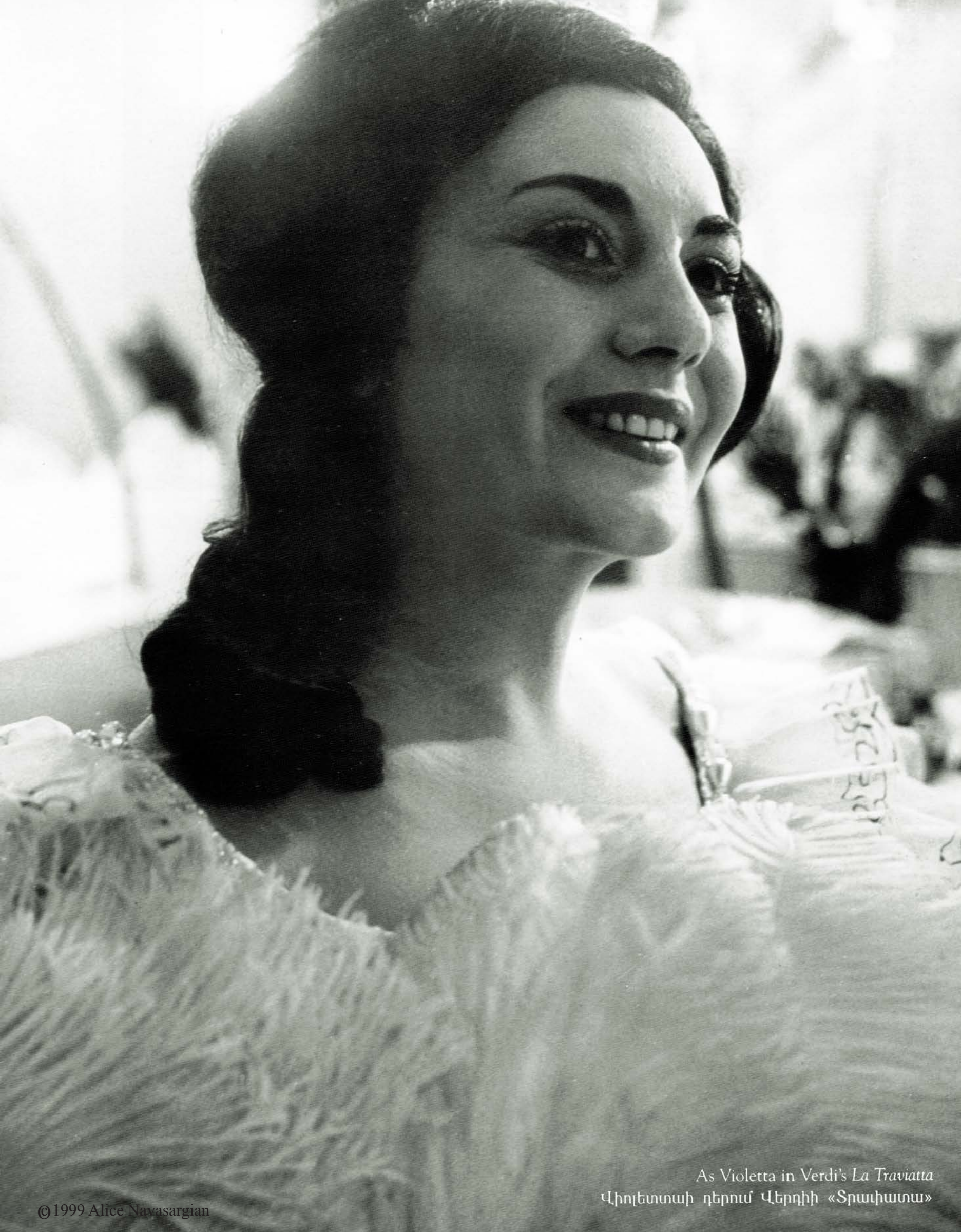
As Violetta in Verdi's La Traviata Վիոլետտայի դերում Վերդիի «Տրավիատա»