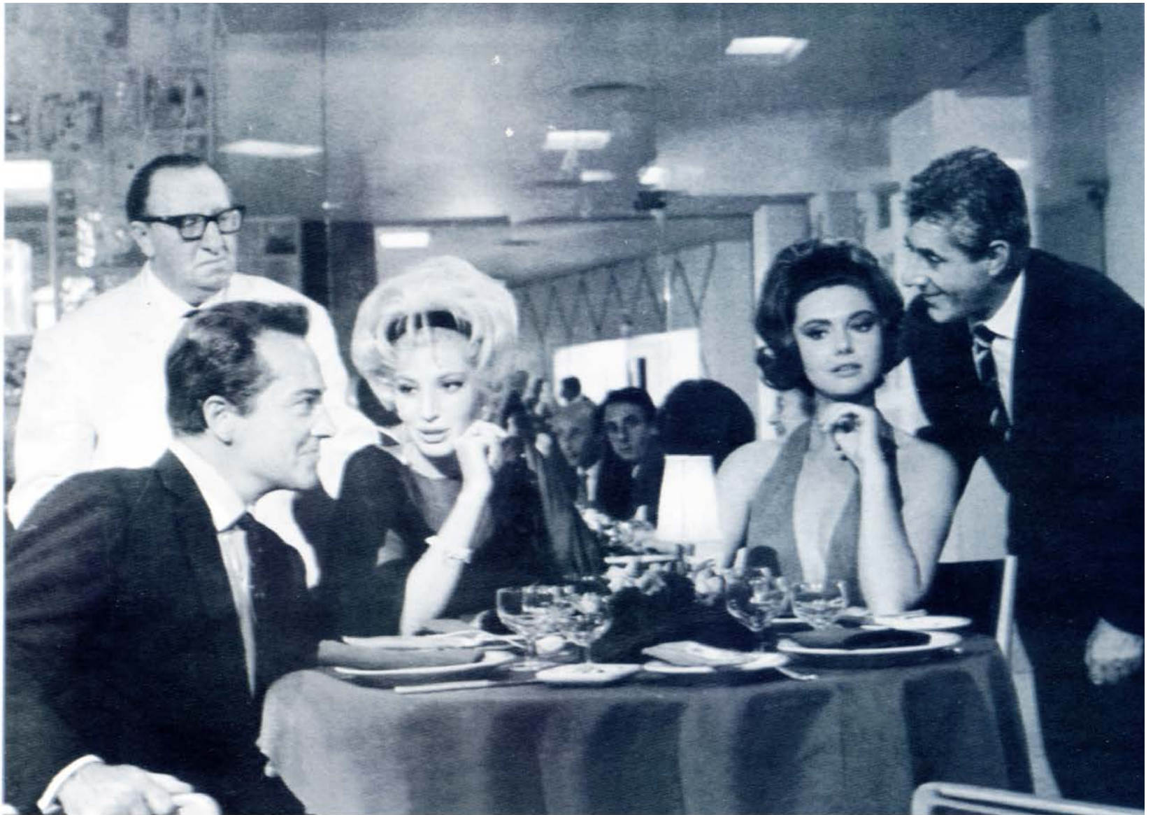
Sylva Koscina with Rossano Brazzi, Mario Passante, Monica Vitti, and Gianrico Tedeschi in the the film The Three Fables of Love , 1963

Սիլվա Կուչինան, Ռոսաննո Բրաթթջին, Մարիո Պասանդին, Մոնիկա Վիտտին և Զիանրիկո Դետեչին՝ «Միտոյ երեք հեքիաթներ»