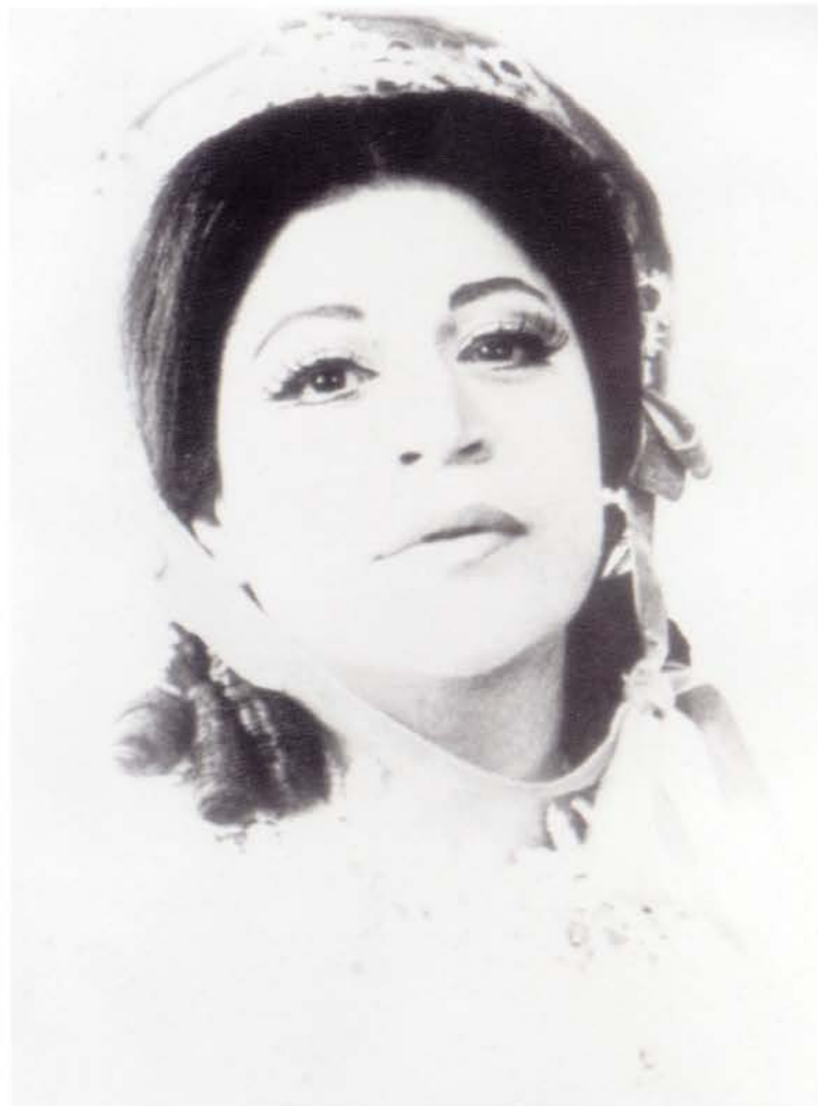
As Amelia in Verdi's Simon Boccanegra